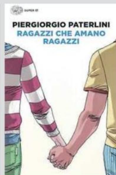
La copertina illustrata da Giuseppe Camuncoli; Piergiorgio Paterlini

scontro con un mondo che sembra urlare loro in faccia che sono sbagliati. E se tanto è cambiato da allora, il valore di queste storie rimane inestimabile. Sono testimonianze di un passato che per molti è ancora presente, un mondo che non possiamo ignorare, come non possiamo ignorare le oltre diecimila lettere che l'autore ha ricevuto nel frattempo, a conferma di quanto questo libro continui a essere in gra-