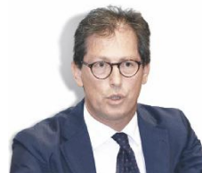
MACKINSON A PAG. 5

PAOLO MIELI "Macché fascismo, non vedo alcun regime in agguato"