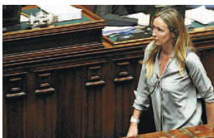
STEFANIA PRESTIGIACOMO Da ventidue anni ha un seggio a Roma

sina con incarichi da ministro, da presidente di commissione e capogruppo nel proprio palmarès. La Finocchiaro fu eletta alla Camera nel 1987 quando ancora c'era il Pci.