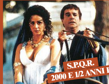
S.P.Q.R. 2000 E 1/2 ANNI FA