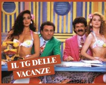
IL TG DELLE VACANZE