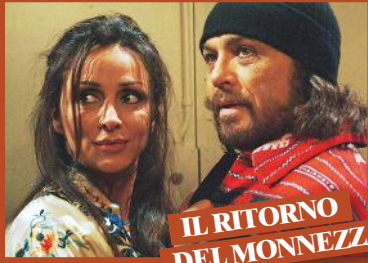
IL RITORNO DEL MONNEZZA