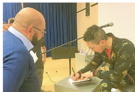
Il rituale del firma copie alla fine della presentazione del libro di Francesco: "Mi chiamano Messi"