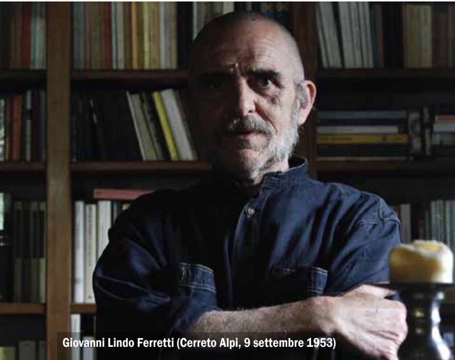
Giovanni Lindo Ferretti (Cerreto Alpi, 9 settembre 1953)

Le confessioni di Giovanni Lindo Ferretti