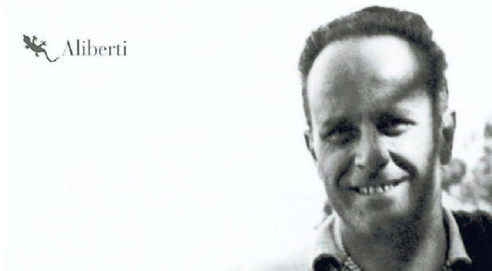
Il ritratto di Loris Malaguzzi che fa da copertina al volume edito da Aliberti acquistabile insieme alla Gazzetta