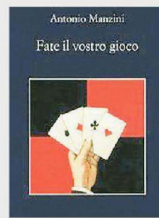
Fate il vostro gioco di Antonio Manzini Sellerio editore. Pagine 406, 15 €

Questa volta il vicequestore Rocco Schiavone deve vedersela con una storia di ludopatia e avidità. Andando su e giù da Aosta al casinò di Saint-Vincent si scontra con le incongruenze di uno Stato che lucra sul fallimento di famiglie trascinate nel fondo del barile dal demone del gioco d'azzardo. Nonostante la complessità dell'indagine Rocco non dimentica e cerca di ricucire i rapporti coi suoi amici romani.