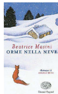
Per maggiori informazioni www.bibliotecapanizzi.it