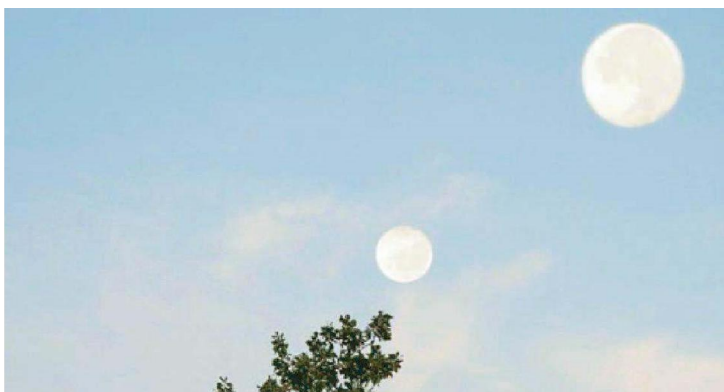
La suggestiva immagine che fa da copertina al volume pubblicato da Aliberti