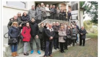
Tutti in gita Il folto gruppo da Cornate d'Adda.