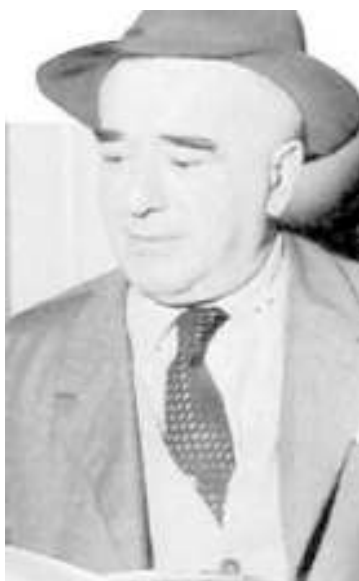
LO SCRITTORE Giovanni Comisso

Le condizioni dell'editoria sono oggi cambiate. I due ostacoli rappresentati dalle grandi tirature e dalla distribuzione attraverso le messaggerie sono stati superati dalla stampa elettronica che permette tirature anche di 2-300 copie e da Amazon a livello nazionale. Per ora, beninteso, è solo un'idea, ma inserita in un programma che punta al rilancio dell'associazione su vari fronti, volando alto. E al riguardo ecco un software che dovrebbe guidare i visitatori della terra trevigiana in tutti i luoghi dove esistono riferimenti letterari: da quelli che ci riportano al Decamerone o alla Divina Com-